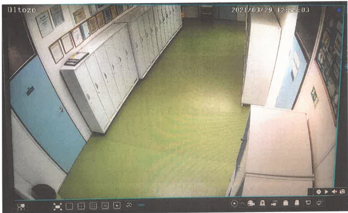
5) számú kamera által megfigyelt terület (öltöző)